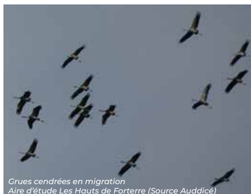
Crues cendrées en migration Aire d'étude Les Hauts de Forterre

Le mât génère aussi des données sur les différentes espèces de chauves-souris présentes sur le secteur. Afin d'avoir une vision complète des enjeux liés à la faune , ces éléments seront corrélés aux données de suivi du parc existant de Taingy (dont dispose la DREAL).