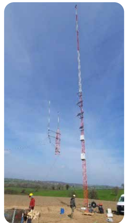
Montage du mât - Fév. 2022