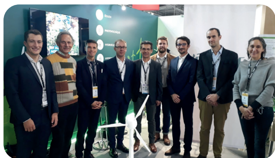
Signature du pacte d'associés en novembre 2021

Ce projet a été pensé de façon participative en intégrant les différents acteurs locaux dès le lancement du projet en 2017. Labellisé "Énergie Partagée", il a obtenu son autorisation administrative en 2022.